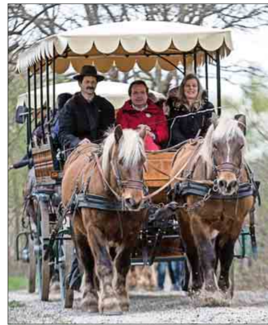
Auch mit der Pferddeckutsche können sich die Besucher des Ecomusée auf dem neuen Verbindungsweg in den Parc du Petit Prince (rechts) bringen lassen.

Diese kann auch in einem neuen Naturlehrpfad im Detail erfahren werden. Dieser schlängelt sich durch die angrenzenden Felder und entlang des Baches durch den Wald.