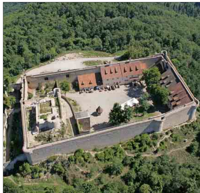
Blick auf die Hohlandsburg

Diese Route führt über rund elf Kilometer vom Weinstädtchen Egguishem nach Husseren-les-Châteaux durch die Berglandschaft westlich des Rheintals bis nach Wintzenheim. Oberhalb von Husseren-les-Châteaux liegen die Donjons d'Eguishem, drei Burgen, die sich in unmittelbarer Nachbarschaft befinden. Nach kurzem Aufstieg erreichen Wanderer die Burgen Dagsbourg, Wahlenburg und Weckmund, er-